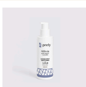
Lozione Spray Viso e Corpo 50ML · AZIONE URTO

Dove la pelle sente, la scienza risponde.