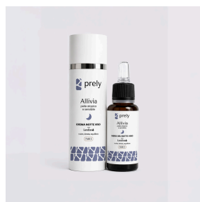
Trattamento Viso Notte in 2 fasi SIERO + CREMA · 15+30ML

Prurito · Rossore · Secchezza · Rughe · Fragilità epiteliale. Quattro referenze: routine giorno e notte, Idrogel e Lozione d'urto.