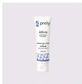
Idrogel Viso e Corpo 15ML · AZIONE URTO